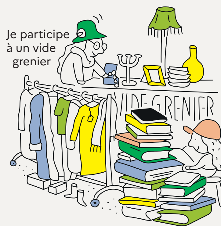
Je participe à un vide grenier