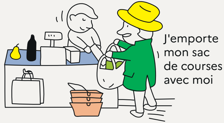
J'emporte mon sac de courses avec moi