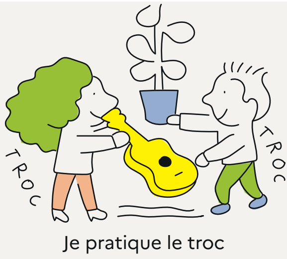
Je pratique le troc