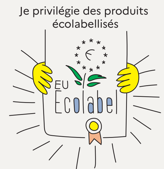
Je privilégie des produits écolabellisés