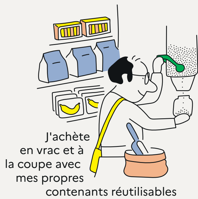
J'achète en vrac et à la coupe avec mes propres contenants réutilisables