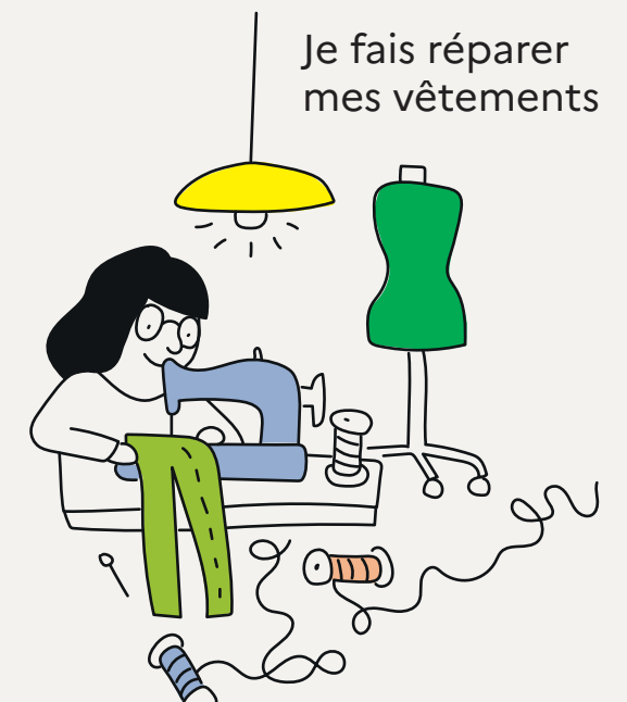
Je fais réparer mes vêtements