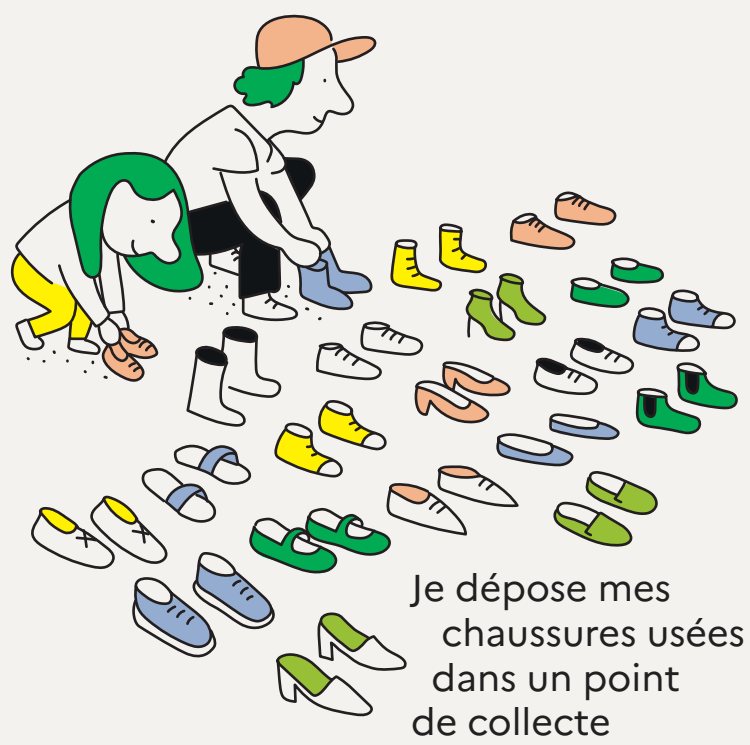
Je dépose mes chaussures usées dans un point de collecte