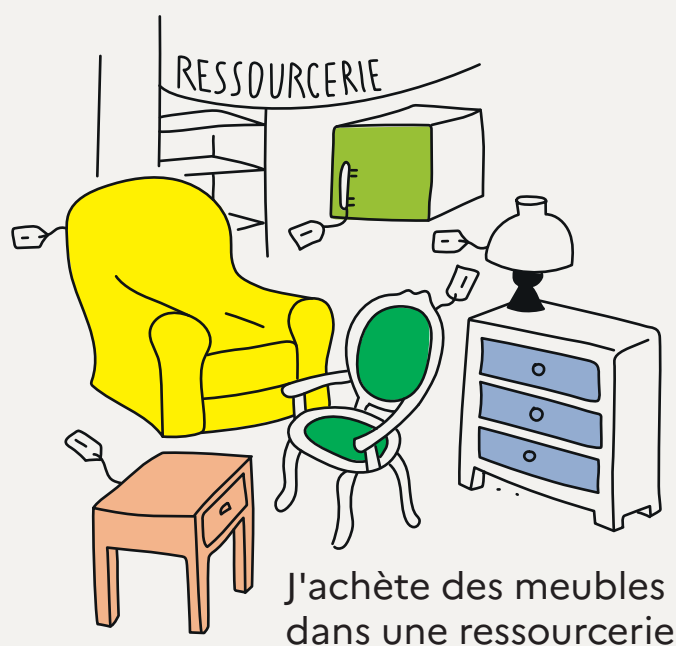
J'achète des meubles dans une ressourcerie