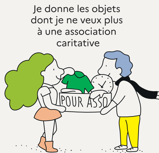
Je donne les objets dont je ne veux plus à une association caritative