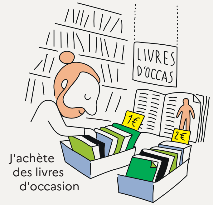
J'achète des livres d'occasion