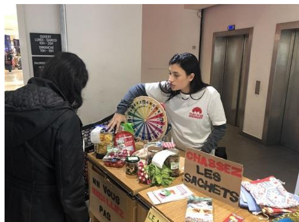
FNE Provence Alpes Côte d'Azur, 2019

Nos choix de consommation dépendent de multiples facteurs, dont bien souvent notre pouvoir d'achat et la force de l'habitude. Ainsi, mieux vaut éviter une approche culpabilisatrice, généralement contre-productrice, mais au contraire mettre en avant les économies réalisables et la facilité du geste. Pour illustrer cela, n'hésitez pas à présenter des exemples concrets de suremballage d'un côté, et d'alternative durables de l'autre. Une équivalence durée d'usage / coût est un must !