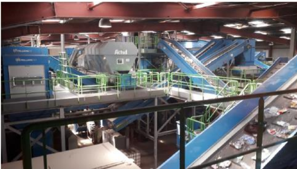
FNE Languedoc Roussillon, 2019

Plusieurs associations du mouvement FNE organisent régulièrement des visites de sites. Ces actions constituent un moyen efficace pour faire découvrir la réalité de la collecte et du traitement des déchets, et de lever certaines interrogations tant sur les méthodes utilisées que sur les installations elles-mêmes. Il peut donc tant s'agir d'une action de découverte et de sensibilisation que d'une forme de vigie citoyenne et de contrôle.