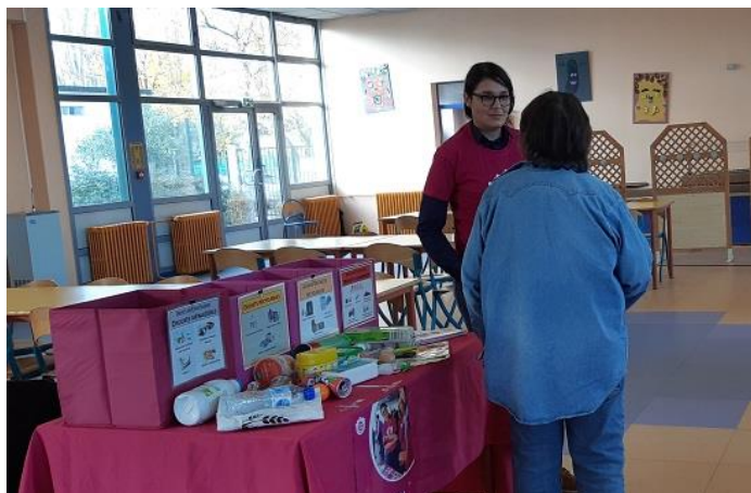
Jeu du Tri, PikPik Environnement, 2019

En mettant en scène des objets à placer dans les « bonnes poubelles », vous pourrez proposer des cas pratiques pour faire (re)découvrir les consignes en vigueur, et lever les doutes existant sur certains objets du quotidien. De plus, vous pouvez étendre votre champ à d'autres types de déchets : textile, piles, déchets électriques et électroniques, déchets alimentaires, etc... Plus efficace qu'un long discours !